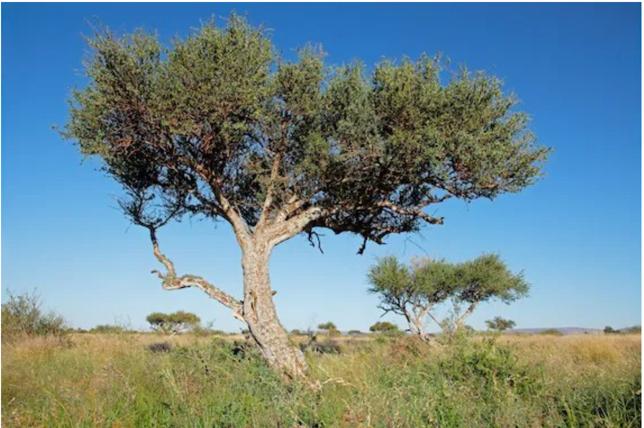
Un individuo di Boscia albitrunca, l'albero con radice più profonda al mondo (68m)

Nostalgia e futuro... “mostrando come le radici possano diventare un algoritmo di senso capace di guidare il futuro” . Sostiene Massimo Montanile in “Radici e Algoritmi. Memorie di un figlio del sud” (Armando Editore, 2026)